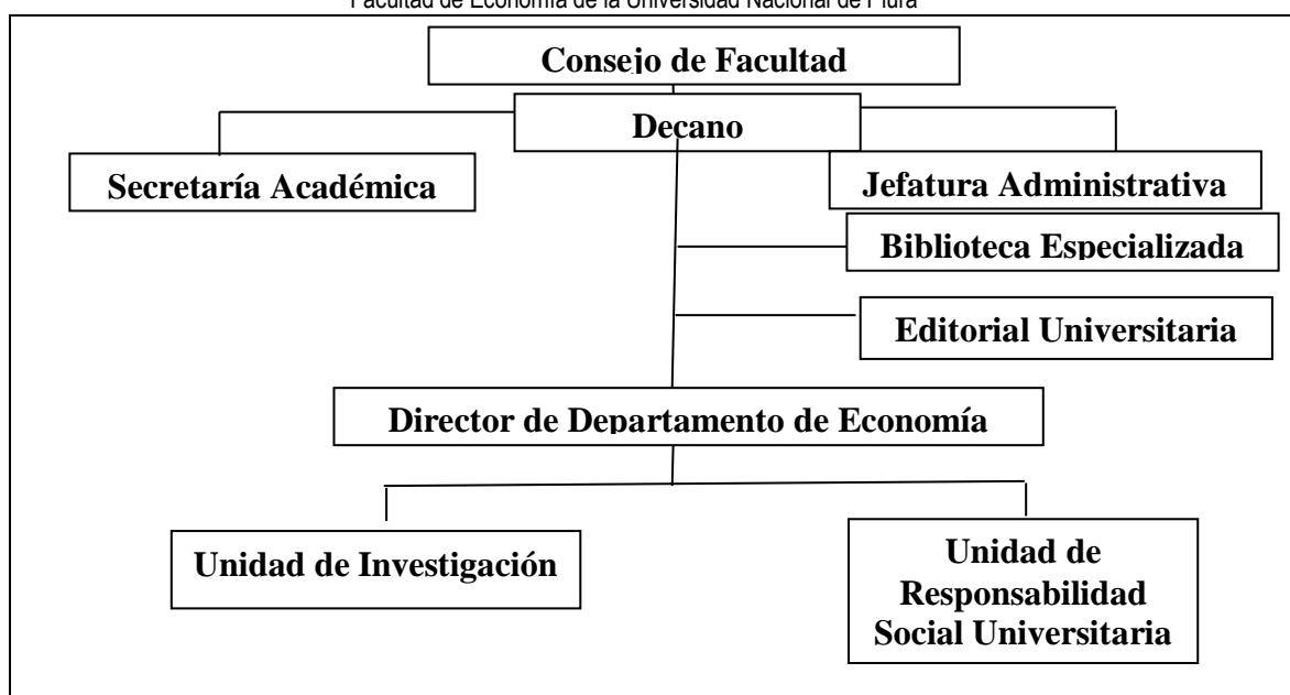
Gráfico N° 03 Estructura Orgánica Facultad de Economía de la Universidad Nacional de Piura

En cuanto a investigación y desarrollo, la Facultad no realiza la publicación de las tesis de egresados de pregrado, recién este próximo año entrara en funcionamiento el repositorio de tesis de la UNP al cual nos acoplaremos, aunque si se encuentran disponibles para consulta interna en la Biblioteca Especializada de Economía.